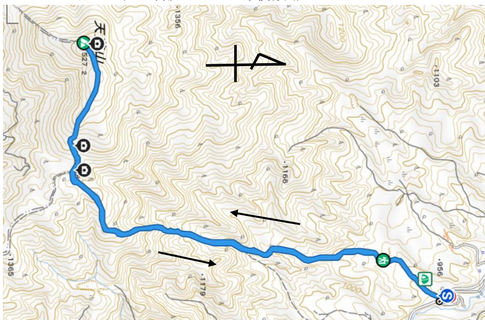
10/8 天蓋山 距離6.3km 累積標高差±624m