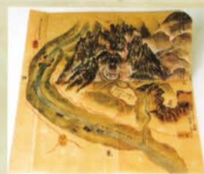
上州吾妻郡岩櫃古城之図(長野県立歴史館蔵)